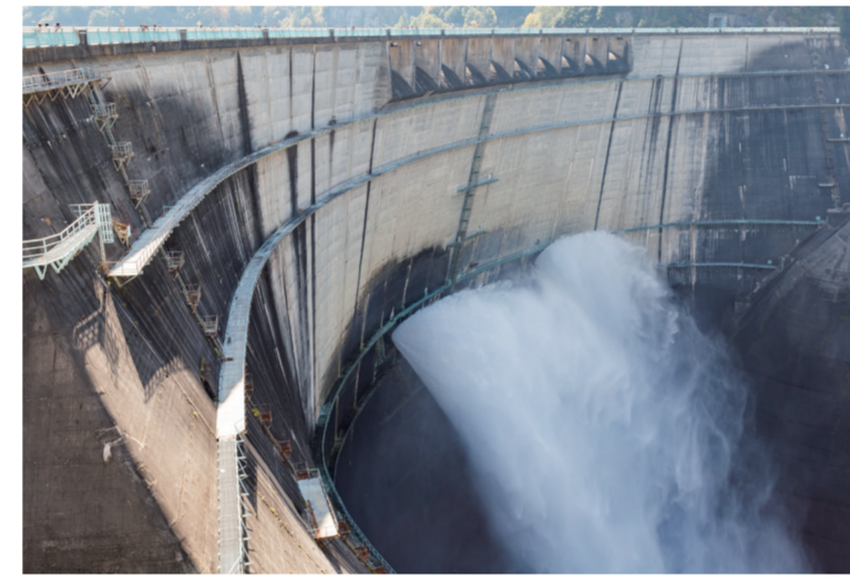
水力発電所（富山県立山町）