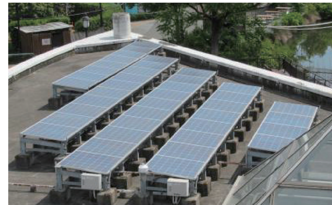
恩賜上野動物園両性爬虫類館