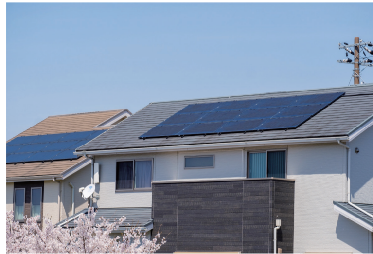
屋根の上についている太陽光発電

さい生かのうエネルギーによる発電は、温室こう果ガスをほとんど出さないため、地球にやさしいエネルギーとして注目されています。