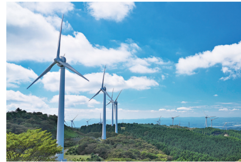
風力発電所（三重県伊賀市）