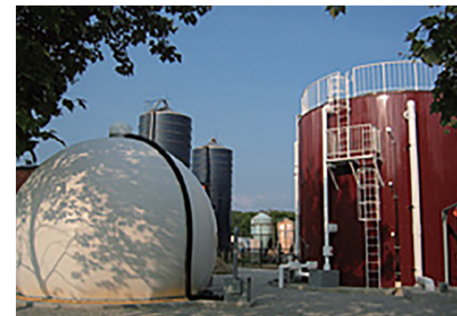
くずまき高原牧場 畜ふんバイオマスシステム

～岩手県岩手郡葛巻町～ このし設では、牧場内の牛のはいせつ物から発生するバイオガスを使って発電しています（出力37kW）。