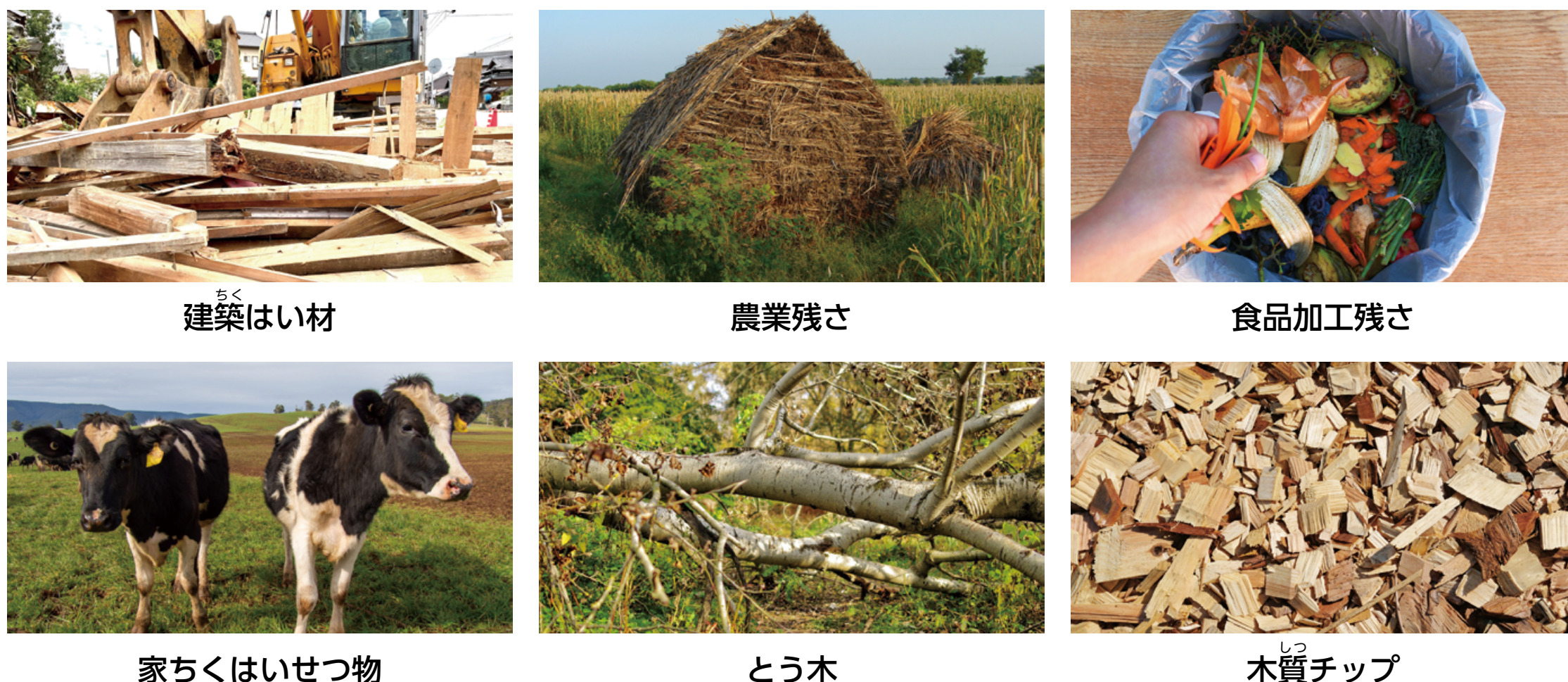
建築はい材 農業残さ 食品加工残さ 家ちくはいせつ物 とう木 木質チップ