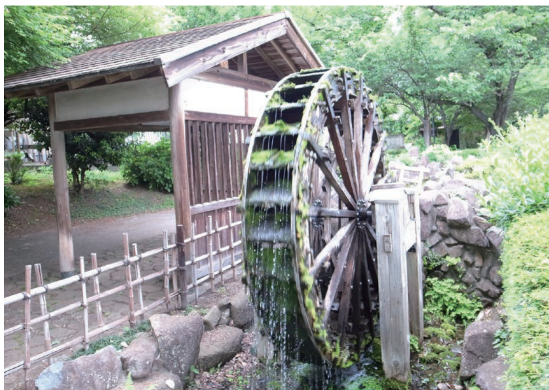
けん すいしゃ とうきょうとみたかし ふく元された水車 (東京都三鷹市)