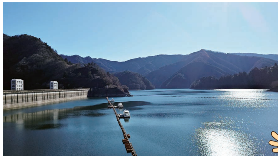
おごうち とうきょうとにしたまぐんおくたままち 小河内ダム (東京都西多摩郡奥多摩町) 小河内ダムは水道せん用のちよ水池ですが水力はつ電にも用いています。