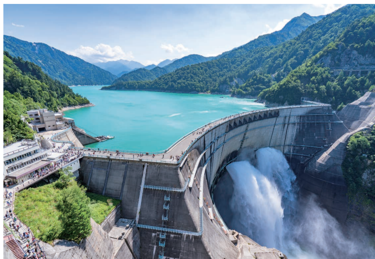
くろべ とやまけん なかにいわくんとたてやままち 黒部ダム (富山県中新川郡立山町)